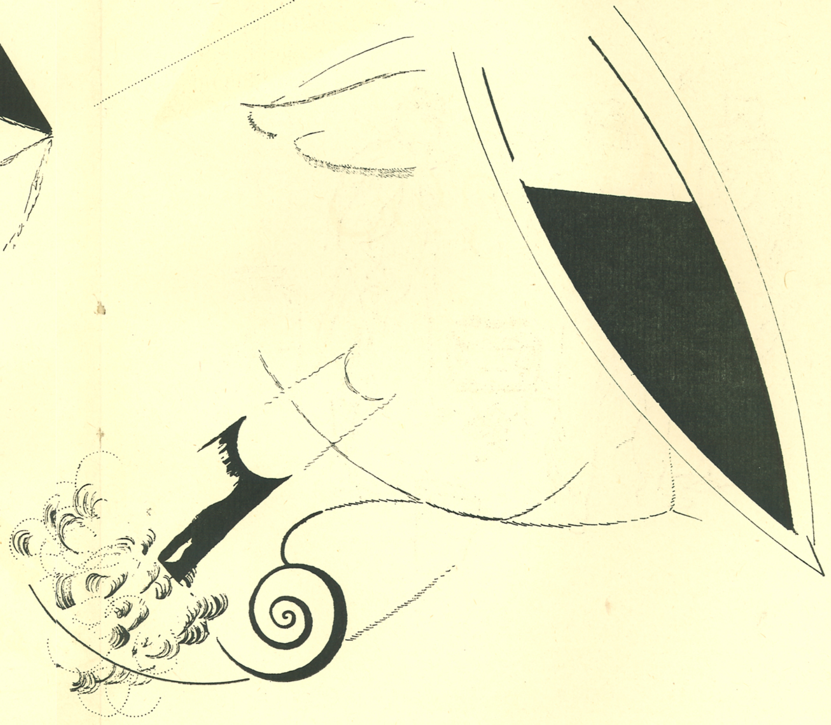
LE CASQUE DU CHASSEUR A CHEVAL MORT A GUEVGUÉLI COMME IL CUEILLAIT UNE FLEUR DE CACTUS QU'IL DESTINAIT A CELLE DE SON CŒUR, DONT LE DESSINATEUR A FEINT TOI LES TRAITS ESSENTIELS