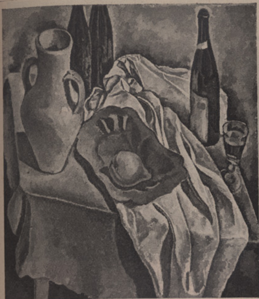
1. Verzeichnis Nr. 11