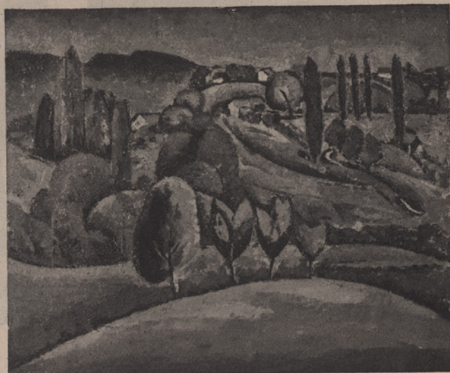
2. Verzeichnis Nr. 4