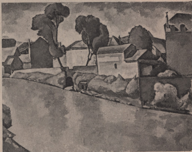
4. Verzeichnis Nr. 9